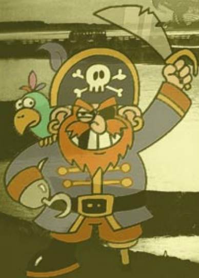
Immagine di copertina di Emanuele Piseri